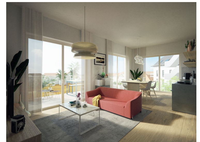
WOHNKÜCHE MIT GROSSZÜGIGEN FENSTERFRONTEN (BAUTEIL 3)

Konträr zu neuen Siedlungen am Dorfrand entsteht hier ein neuer Lebensraum im Dorfkern. Dieser sorgt für frischen Wind und verdichtet auf behutsame Weise die Dorflandschaft.