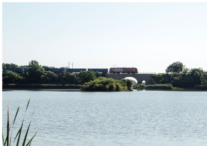
ZÜGIG UNTERWEGS – AUF DEN STRECKEN DER KFNB – SEIT 1849

Ein Tagesausflug über die Grenzen lohnt sich. Die tschechische Kleinstadt Breclav hat besuchenswerte Orte im Repertoire: das Schloss, die Schlossbrauerei und viele nette Gaststätten. Barocke und modernistische Formen, gealterte und neue Oberflächen erzählen von Tschechiens bewegter Geschichte.