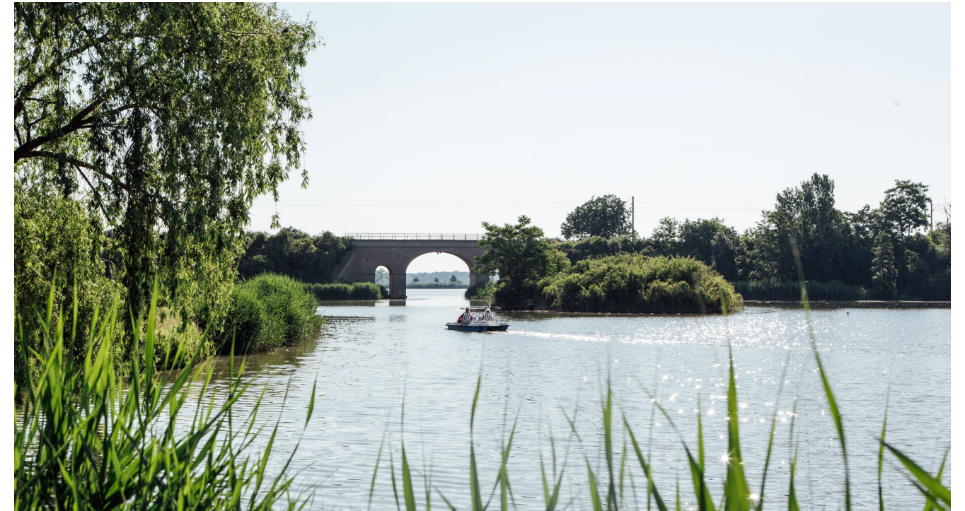
DER BERNHARDSTHALER LANDSCHAFTSTEICH, AUCH „OASE DES WEINVIERTELS“ GENANNT, IST DIE GRÖSSTE WASSERFLÄCHE DES WEINVIERTELS. ER GEHÖRT ZUM LETZTEN REST EINER EINST GROSSEN TEICHLANDSCHAFT UND WIRD VON EINER EISENBH-ZIEGELBRÜCKE GETEILT. DIESE WURDE 1939 VON KARL RITTER VON GHEGA 1839 ERRICHTET.