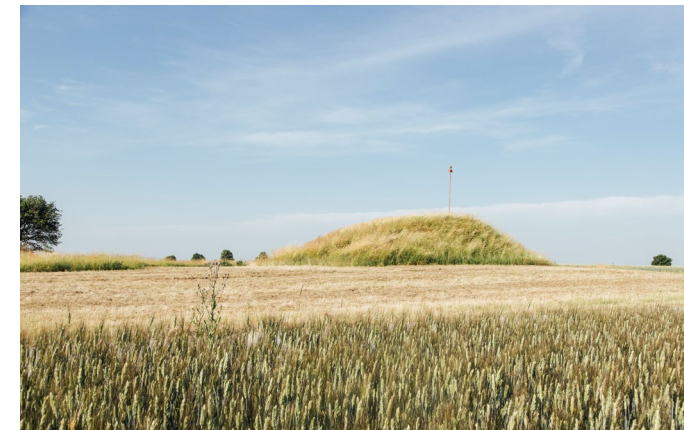
HÜGELGRÄBER AUS DER HALLSTATTZEIT