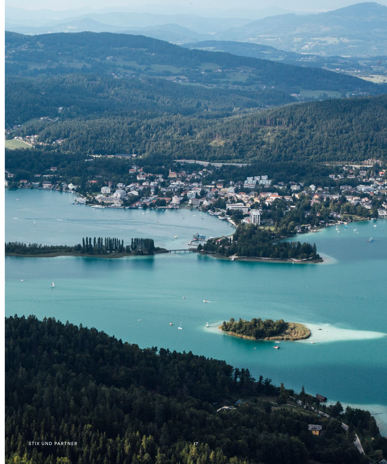
AUSBLICK VOM PYRAMIDENKOGEL RICHTUNG PÖRTSCHACH