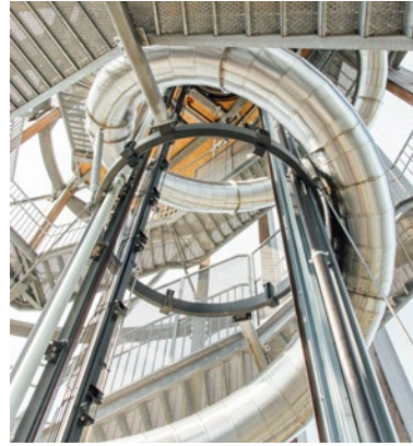
DIE 120 M LANGE RUTSCHE DES AUSSICHTSTURMS PYRAMIDENKOGEL

ist eine Gemeinde im Keutschacher Seental, am Fuße des Pyramidenkogels. Dort oben, 851 m über dem Meeresspiegel, befindet sich in exponierter Lage der höchste Holzaussichtsturm (100 m) der Welt. Die Aussicht ist phänomenal: Zu Füßen liegt das Kärntner Land, so mächtig wie ein schlafender Riese. Seen, Wälder und sanfte Hügel, märchenhaft schön.