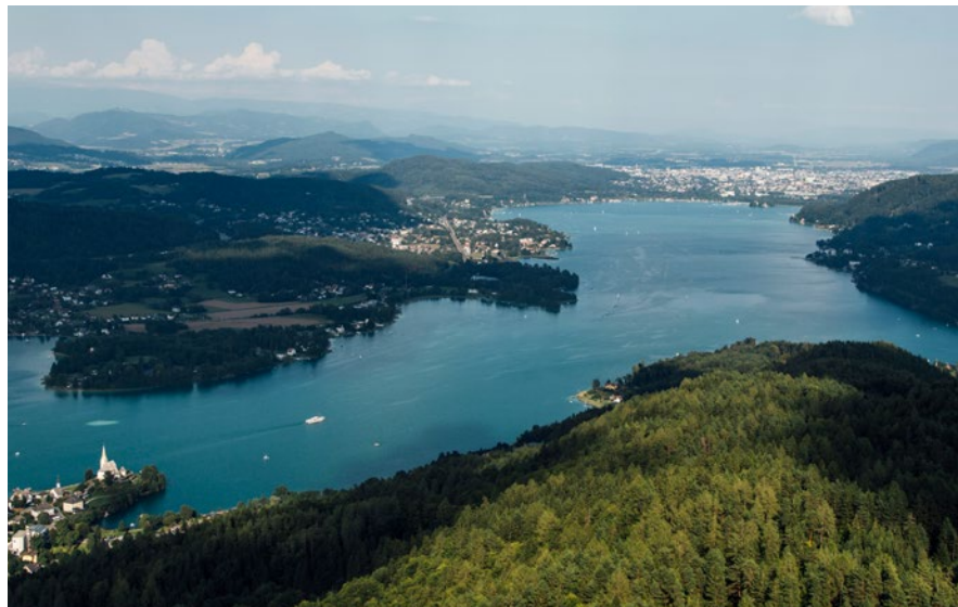
AUSBLICK VOM PYRAMIDENKOGEL RICHTUNG KLAGENFURT