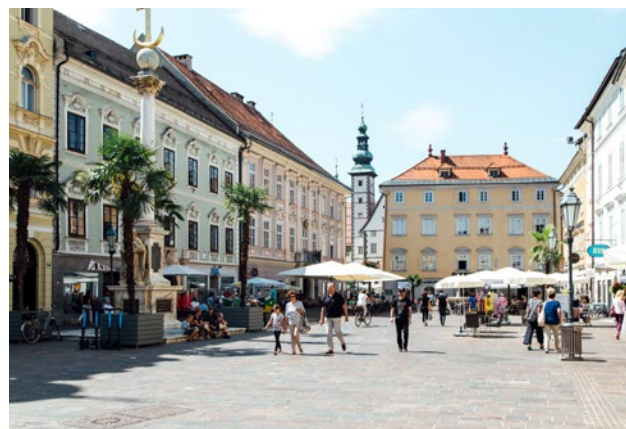
FUSSGÄNGERZONE KLAGENFURT MIT SÜDLÄNDISCHEM FLAIR

Attraktive Wander- und Radrouten bereichern die Region, und die nahe gelegene Bushaltestelle sorgt für Anschluss: Das Klagenfurter Stadtzentrum und der Hotspot Velden am Wörthersee sind auch ohne Auto gut erreichbar.