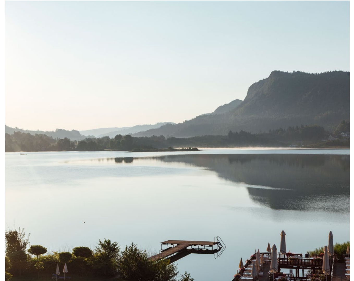
BLICK AUF DEN VERTRÄUMTEN KEUTSCHACHER SEE BEI SONNENAUFGANG

Großflächige Fensterwände öffnen den gesamten Wohnraum zum Wasser hin: Der naturbelassene Keutschacher See und der Gebirgszug der Sattnitz ergeben ein malerisch komponiertes Landschaftspanorama. WATER SIDE ist ein traumhafter Rückzugsort, der zum Bleiben einlädt.